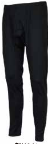
●サイズ:S, M, L BP6 BLACK