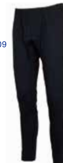
●サイズ:S, M, L R14 DUSK C14 CARBON