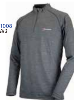
●サイズ:S, M, L R14 DUSK C14 CARBON