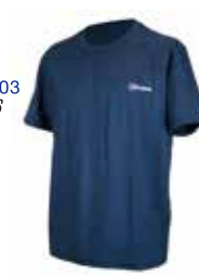
●サイズ:S, M, L C66 TWILIGHT BLUE W07 QUARRY