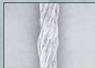
Impact FX Wool Yarn REDAのウール糸