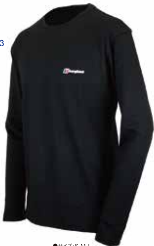
●サイズ:S, M, L BP6 BLACK