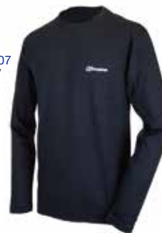
●サイズ:S, M, L R14 DUSK C14 CARBON