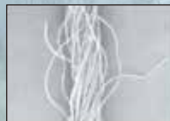
Conventional Wool Yarn 一般的な紡績工程を経たウール糸

紡糸工程におけるこの技術は、糸を撚る前に繊維を整然と平行に揃え、繊維同士をより近い位置におくことを目的としています。そして撚糸の際の「spinning-triangle(撚糸する際に現れる三角形)」を最小にすることで張力も弱まり一すなわちテンションを最小にすることにより糸質の安定を図り一完璧なコンパクト糸としてもっとも重要な価値尺度を持っています。