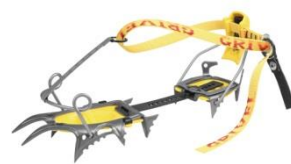
グリベル エアーテック オーマチック SP