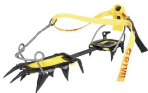
グリベル G12 オーマチック SP

着脱も素早く、靴とアイゼンの一体感が最も高いので、シビアな雪山登山に適します。ブーツとの相性によっては、つま先とワイヤー部分に隙間ができて外れ易くなる場合があるので、ご自身のブーツと合うかどうか確認して下さい。また、かかと と つま先にコバが無いブーツやソール剛性の低いモデルのブーツには使用できません。