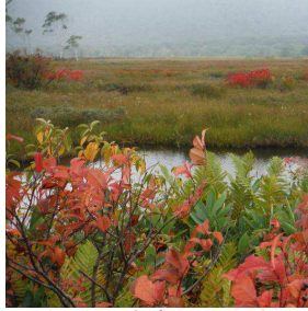
(秋の気配も感じられます)

行 程 : ① 鳩待峠(11:00 集合)・山ノ鼻・中田代・牛首分岐・竜宮十字路・見晴(尾瀬小屋泊) ② 見晴・東電小屋・ヨツビ吊橋・中田代・牛首分岐・山ノ鼻・鳩待峠(13:00 頃着・解散予定) [歩行時間 1日目:約3時間 2日目:約4時間]