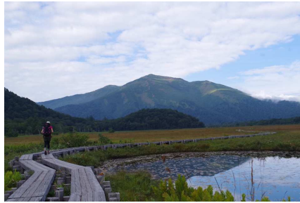
(尾瀬ヶ原と至仏山・イメージ)

期 日 : 9月2(土)～9月3日(日) ※原則として雨天の場合も実施致します。 集 合 : 午前11時00分 鳩待峠バス停付近 解 散 : 午後1時00分頃 鳩待峠バス停付近 募集人員 : 15名様(最少催行人員8名様) 受講料 : 20,000円(部員価格) 21,000円(一般価格) 同 行 : 公益社団法人日本山岳ガイド協会認定ガイド ※旅行代金に含まれるもの : ガイド同行費・保険料・山小屋宿泊費(尾瀬小屋/1泊夕・朝食付)