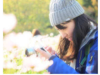
(撮影も楽しみましょう!・イメージ)

行 程 : ① 鳩待峠(11:00 集合)・山ノ鼻・中田代・牛首分岐・竜宮十字路・見晴(尾瀬小屋泊) ② 見晴・東電小屋・ヨツビ吊橋・中田代・牛首分岐・山ノ鼻・鳩待峠(13:00 頃着・解散予定) [歩行時間 1日目:約3時間 2日目:約4時間]