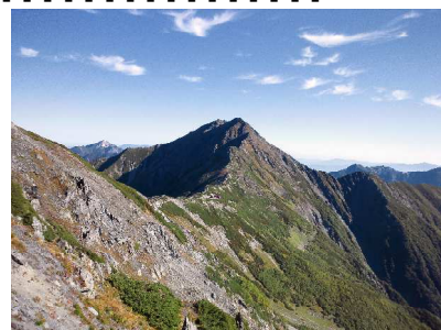
(北岳を望む/イメージ)